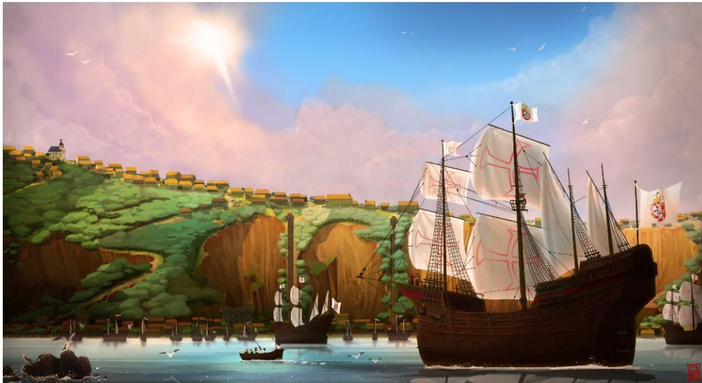
"Chegada a Salvador" - Cena da série The Elephant and Macaw Banner. Pintura por Leonardo Amora

The Elephant and Macaw Banner é trademark do Christopher Kastensmidt. Todos os personagens, imagens, e histórias associadas com a série são copyright Christopher Kastensmidt com todos os direitos reservados.